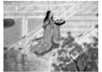
源氏物語図屏風「少女」

今年平成20年(2008年)は、世界最古の長編小説『源氏物語』の存在が記録で確認されてからちょうど千年目にあたります。