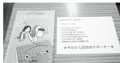
講座パンフレット