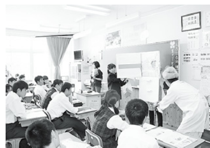
寸劇で学ぶ生徒たち