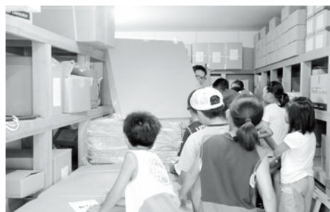
防災倉庫を見学する子どもたち

その後は調理室へ移り食事の準備をしたり、消火器の使い方を学んだり、いつ起こるか分からない災害への備えを学習する機会となりました。