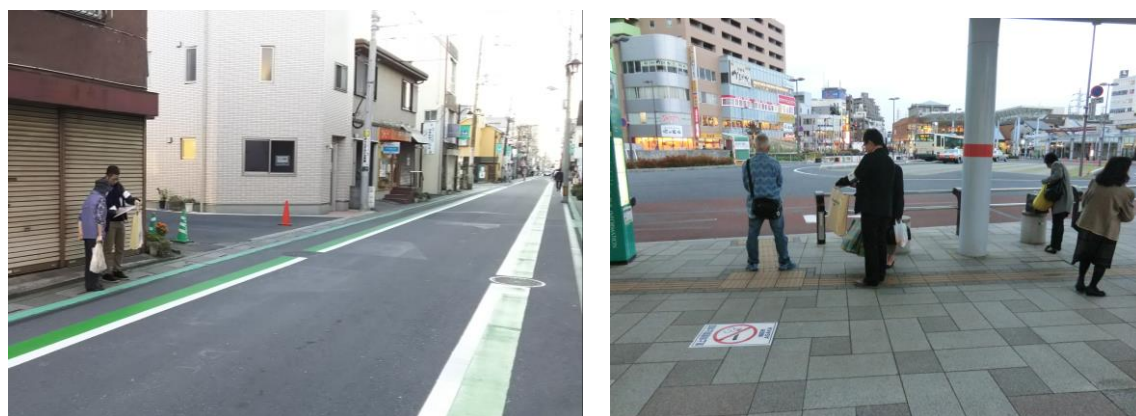
図 聞き取り調査の様子