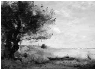
カミーユ・コロ 《ヴィル・ダヴレーの 湖畔の朝霧》