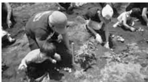
じゃがいも掘り体験