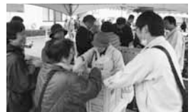
農業祭・にんじん詰め放題

ニンジン、カロテン以外にも、ビタミン類やカリウムなどのミネラル、食物繊維をたくさん含んでいます。煮ても、炒めても、漬けてもおいしく食べられますので、皆さんも、たくさん食べてくださいね!