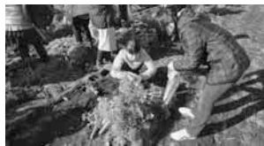
にんじん掘り体験