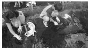
さつまいも掘り体験

朝霞市都市農業推進協議会では、親しまれる都市農業を目指して、さまざまな農業体験(田植え、じゃがいも掘り、稲刈り、さつまいも掘り、にんじん掘り)を実施しています。