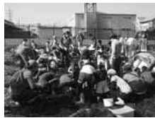
昨年のさつまいも掘り