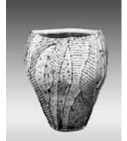
埼玉県議会議長賞 「鉄彩線紋花器」(工芸) 内田好江氏作