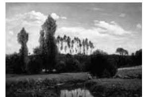
ルエルの眺め クロード・モネ