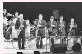
Asaka Swing Fellows

内容/すっかり朝霞に根付いたビッグバンド「Asaka Swing Fellows」のジャズライブ。ゲストには日本の名サクソプレーヤー田辺信男をお迎えします。