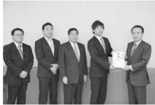
読売新聞朝霞支部の皆さんと富岡市長