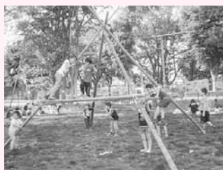
朝霞の森でのプレーパーク