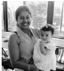
お子さんと一緒にパチリ♪