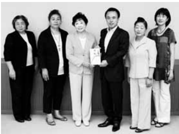
公益社団法人朝霞法人会女性部会の皆さんと富岡市長