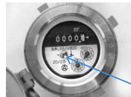
水道メーターの パイロット