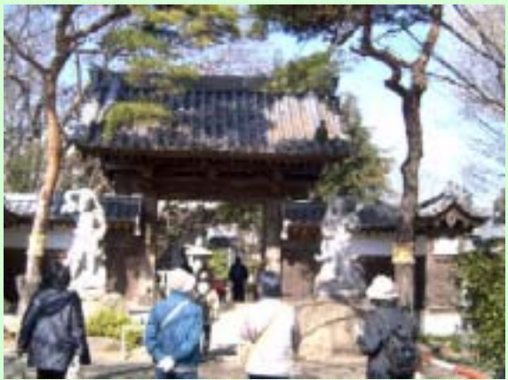
東園寺 境内は一周する自然路が散策でき、不動堂の湧水も一見の価値がある