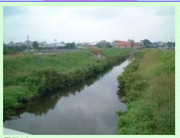
黒目川 城山公園の麓を静かに流れる。両側の土手は憩いの散歩路