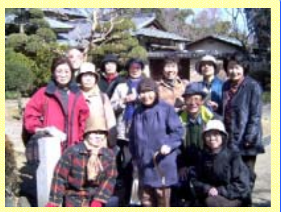
私たちのお奨めコースです