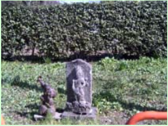
東園寺 境内にはお地蔵さんがあちこちに佇む風情がある