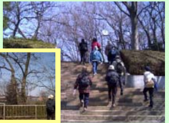
城山公園 幼い頃走り回った裏山が今はきれいな公園となって！