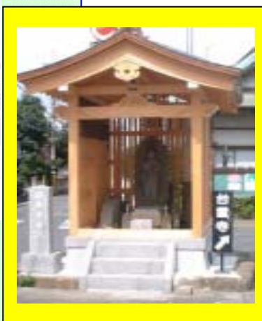
再建された馬頭観音