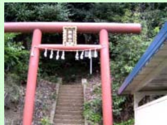
御嶽神社 思わざる秘境？雑木林の中に古風な神社があり、木々の間から幸魂大橋の風景が見られる