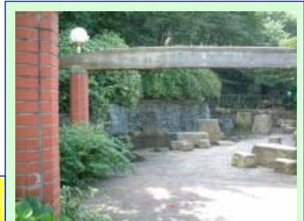
水久保公園 二輪草など草花が豊富、バーベキュー施設もあるので屋外焼肉も出来るヨ