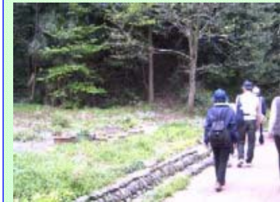
根岸台遊歩道の水路