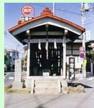
馬頭観音 5 叉路の真ん中にあるため交通事故に遭い再建中だった