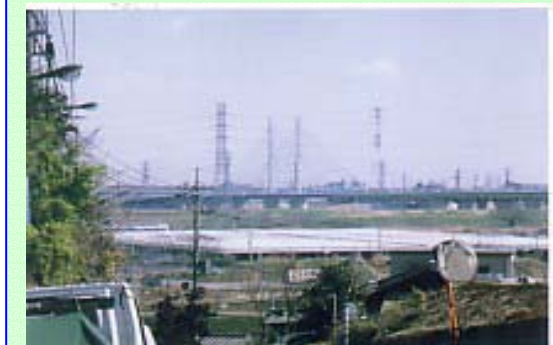
ダイ坂付近から幸魂大橋を望む