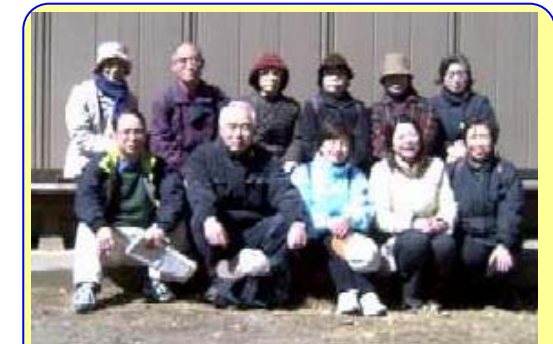
私たちのお奨めコースです

市を代表する自然湧水のひとつで越戸川の源です。池には鯉が泳ぎ、冬季には渡り鳥も見られます