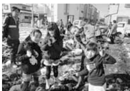
にんじん掘り体験