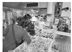
あさか新鮮野菜市

販売時間は、午前9時30分～午後1時までです(ただし、品物がなくなりしだい終了です)。