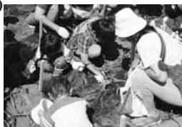
さつまいも掘り体験