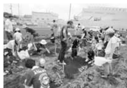
じゃがいも掘り体験