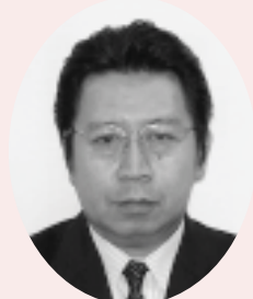
利根川仁志 副議長