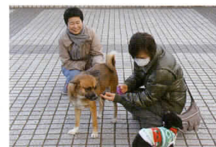
中央公園は犬の散歩コース