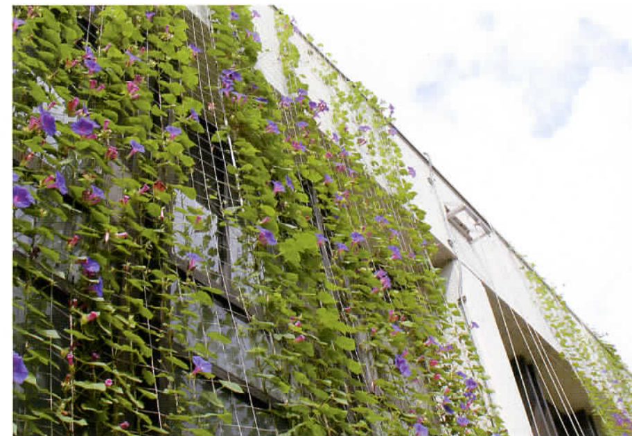
市庁舎のグリーンカーテン