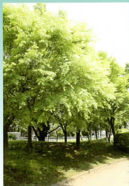
新緑の青葉台公園