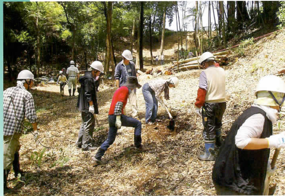
緑地ボランティア活動