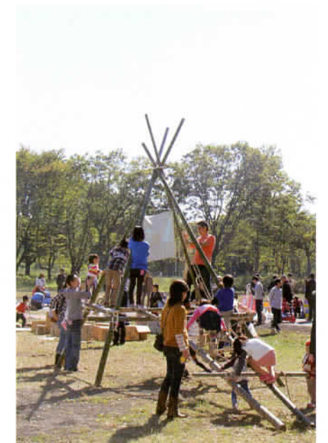
基地跡地暫定利用広場「朝霞の森」でのプレーパーク