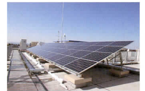
朝霞第五小学校のソーラーパネル