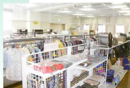
リサイクルショップ(エコネットあさか)