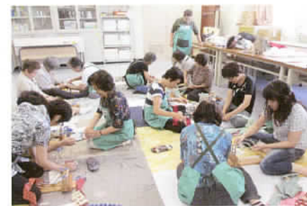
エコネットあさか講座「布ぞうり作り」