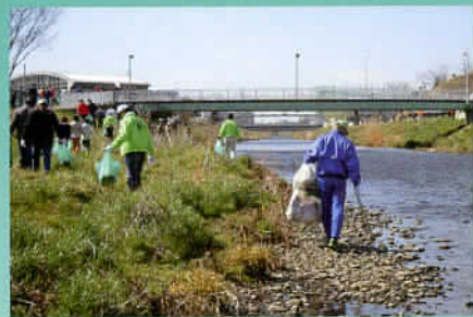
黒目川堤防清掃活動