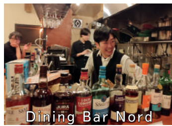
Dining Bar Nord

ぜんぜん高くない常連さん同士の壁をずっと超えたら、気軽な飲み仲間がたくさんできます。お店によっては楽器使い放題、生演奏歌い放題といった、実は内緒にしたい素敵などころも。