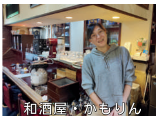
和酒屋・かもりん