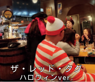
ザ・レッド・タグ ハロウィンver.