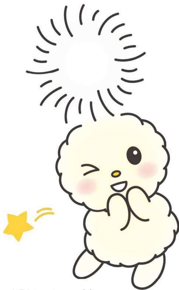
朝霞市キャラクター ほほたん