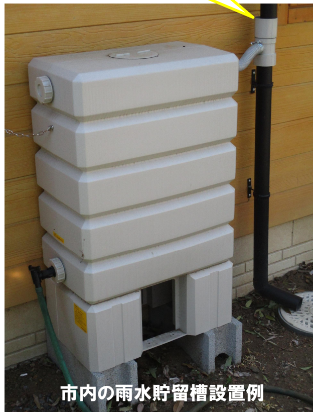
市内の雨水貯留槽設置例