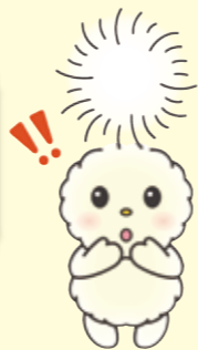
けんこう大使ぼぼたん ©むさしのフロントあさか

バスで受ける 集団健診です ※バスには階段が ありますので、 ご心配な方は ご相談ください。