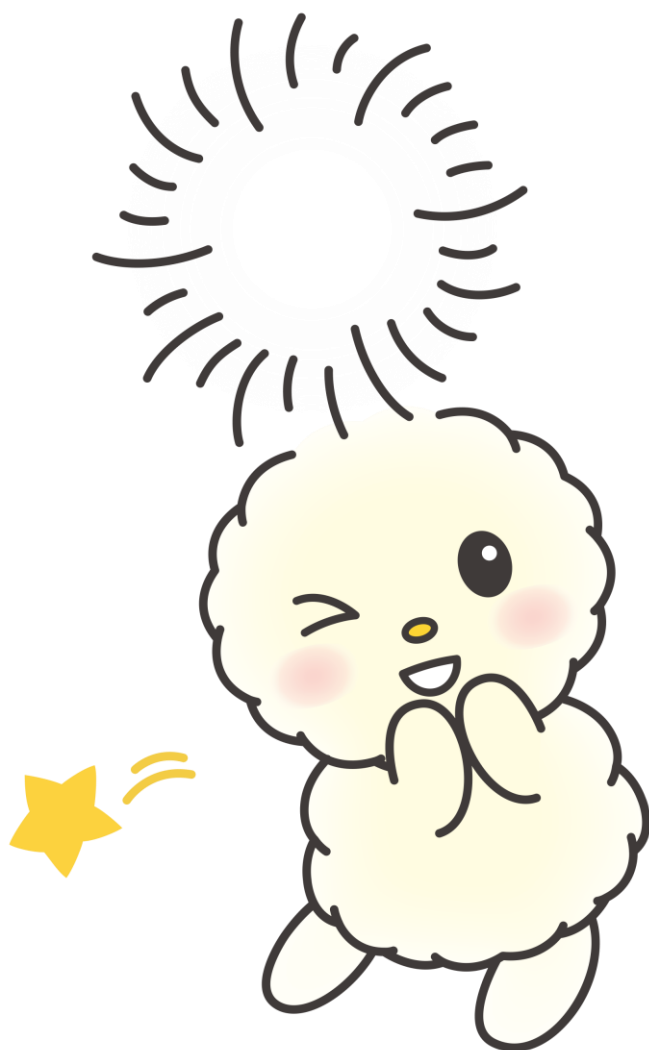
朝霞市キャラクター ぼぼたん