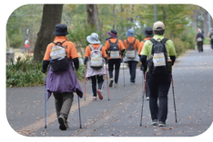
ウォーキングイベント