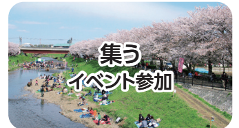
集う イベント参加