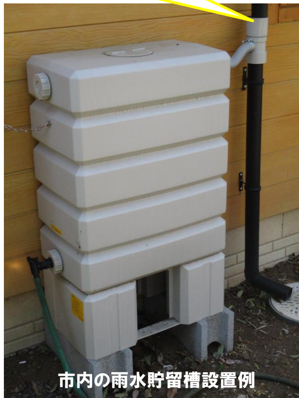
市内の雨水貯留槽設置例