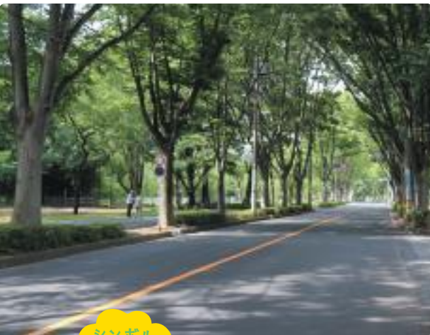
シンボル ロードの 春夏秋冬