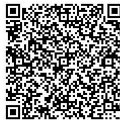
【団体登録フォーム】