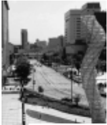
※シンボルロードのイメージ写真