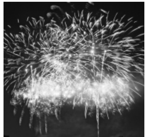
夜空を彩る彩夏祭の花火

A: 現在、市で設置している基地跡地整備計画策定委員会に取りまとめを行う予定の基地跡地整備計画（最終案）を基に、来年の6月までに、基地跡地全体の利用計画を作成し、国に提出することになっています。利用計画書には、基地跡地全体の土地利用のゾーニング計画のほか、取得・整備の方法や市の財源計画なども添付する予定です。