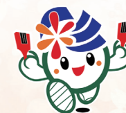
彩夏祭シンボルキャラクター あさか 彩夏ちゃん