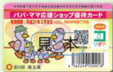
パパ・ママ応援ショップ優待カード

優待カード裏面にご家族(世帯)の方の氏名を記載してください。カード裏面に利用者の氏名が書かれていない場合は、協賛店舗でのサービスが受けられない場合があります。