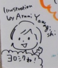
Illustration by Arumi Yawagishi