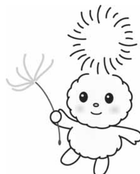
朝霞市キャラクター ぼぼたん