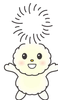
ほぼたん（朝霞市キャラクター）

〒351-8501 朝霞市本町1丁目1番1号 朝霞市役所 総務部 職員課 TEL048-463-1111(代表) 内線2352 TEL048-463-3191(ダイヤル)