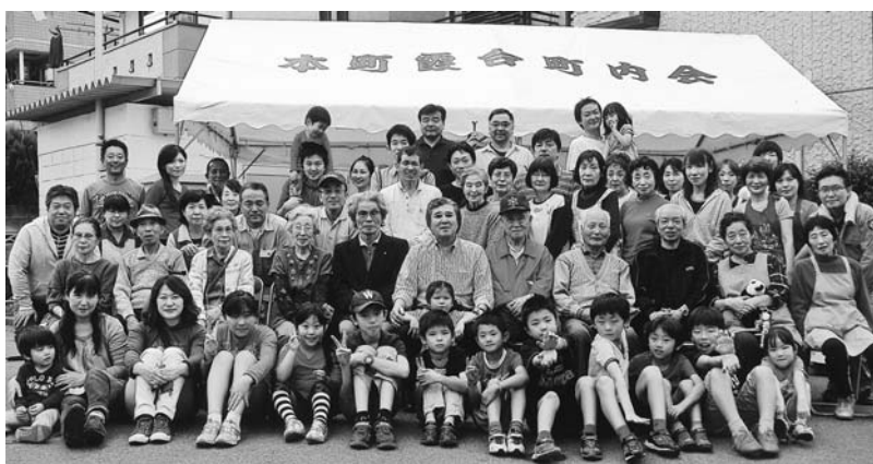
餅つき大会で記念にパチリ

しかし、餅つきそのものより、事前の準備がより大切なのだと思います。みんなでワイワイガヤガヤやるのが、人と人とを強く結びつけ、なんでも語