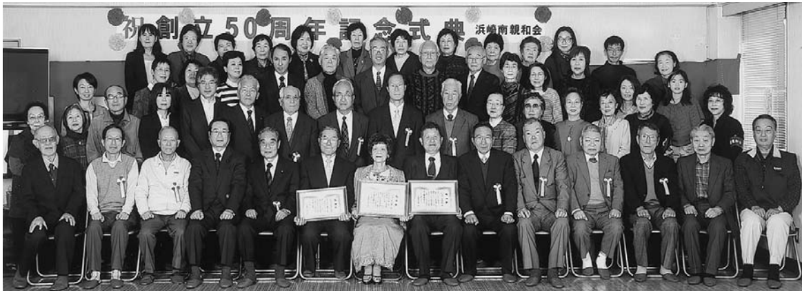
創立50周年記念式典

は町内会員の「継続は力なり」の考えによるものと思っています。この伝統を尊重し、今後も派手ではないが、着実な町内会運営を目指します。