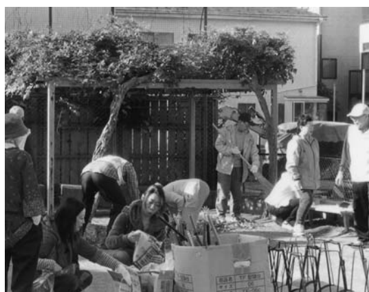
きれいなまちづくり運動参加のようす

このような状況下において、災害時の対応に悩まされています。幸い、朝霞市自治会連合会二区の九町内会のうちの五町内会で、自主防災会（三原連合町内会自主防災会）が平成22年に結成され、第一回の防災訓練を平成23年11月、朝霞市との共催により実施し、その成果を得ることができました。そ