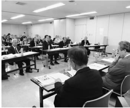
▲意見交換会の様子 (手前右が多摩市自治連合会役員の皆様)

朝霞市とは人口、面積、都心のベッドタウンである点など似通っている部分が多く、充実した意見交換ができました。