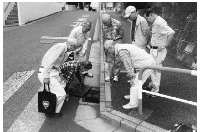
デング熱の蚊の発生状況を調査

当町内会は、昭和44年に町内子供会であったものを町内会に昇格させて発足し、現在は溝沼連合町内会に属して