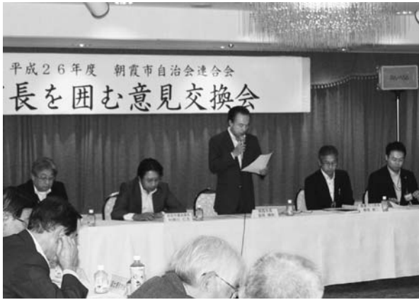
答弁する富岡市長（写真中央）