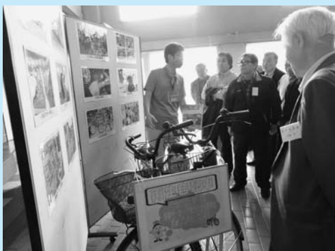
▲リサイクルプラザにてごみ処理の流れを学ぶ

自治会にとって身近な問題であるゴミの分別方法や出し方などについて改めて考えさせられました。