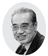
朝霞市自治会連合会会長