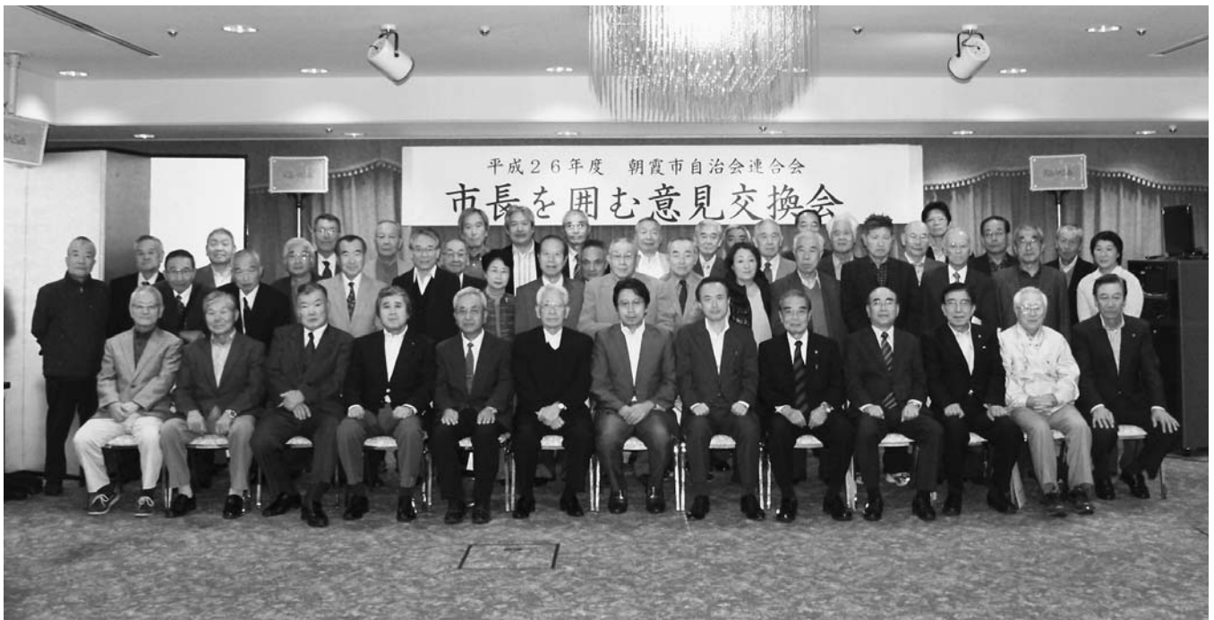
平成26年10月23日（木）、ゆめぱれすにて「市長を囲む意見交換会」が開催されました（2ページ参照）。