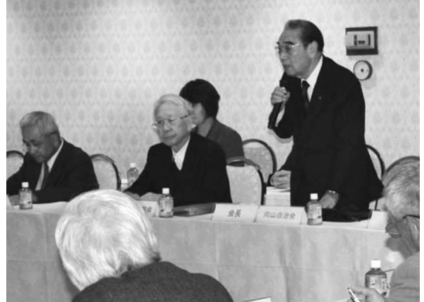
質問する島連合会長

朝霞市自治会連合会では、毎年「市長を囲む意見交換会」を開催しています。これは、自治会・町内会長と市長および市執行部とが意見交換をすることで、よりよい地域づくりを目指すことを目的としています。 今年度も10月23日に市民会館において開催し、自治会連合会側から11問の質問（下表参照）を行い、市執行部からご回答をいただきました。 自治会からの質問と市の回答について一部抜粋して紹介します。