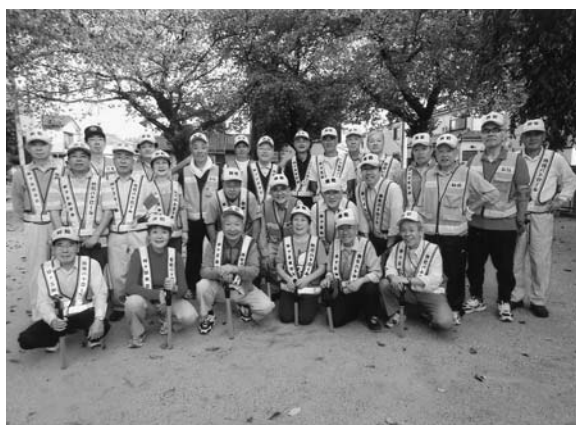
緑ヶ丘自主パトロール隊

2月には初午祭、3月は樹齢65年の公園の桜のライトアップ、5月の子供の日には神輿、山車で町内を渡御する例大祭、8月には納涼盆踊り大会、公園広場での夏休みラジオ体操、9月は紅白町内運動会と敬老対象者への祝品の配布や市民会館へのバスでの送迎（本年は中止となりました）、10月は市民体育祭へ参加。下旬には緑ヶ丘会館で第50回緑ヶ丘文化祭を開催、11月は緑ヶ丘自主防災訓練（朝霞市消防署指導に依る）、12月は35年続いている餅つき大会、12月〜翌2月まで火災予防地域の安全のため全戸参加で夜警を実施、といった内容です。また、年間行事となっているものでは、女性ボラ