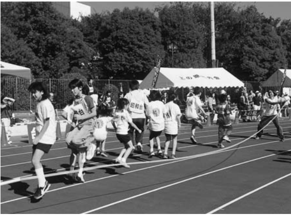
息をあわせて、チームでジャンピング!

昔はたぬきがたくさんいたことから、たぬきがトレードマークとなり、オリジナルのたぬきTシャツや応援旗がありました。また、「昭和台」という名前から昭和の懐かしいにおいもするよう नाही しような…。住んでいる人たちも温かく、お互いが声かけあつて暮らしています。