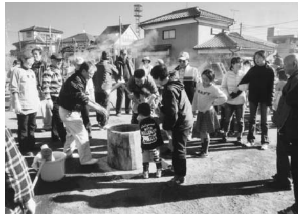
12月恒例の餅つき大会

防犯パトロールは、18名で2班、2コースを夜7時から月3回実施するほか、消火器も19基設置、安全・安心な