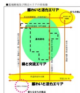
基地跡地及び周辺エリアの将来像