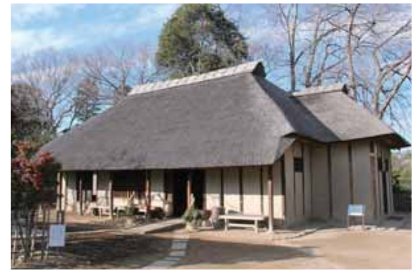
②重要文化財 旧高橋家住宅