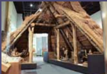
復元住居「古墳時代」(復元模型)