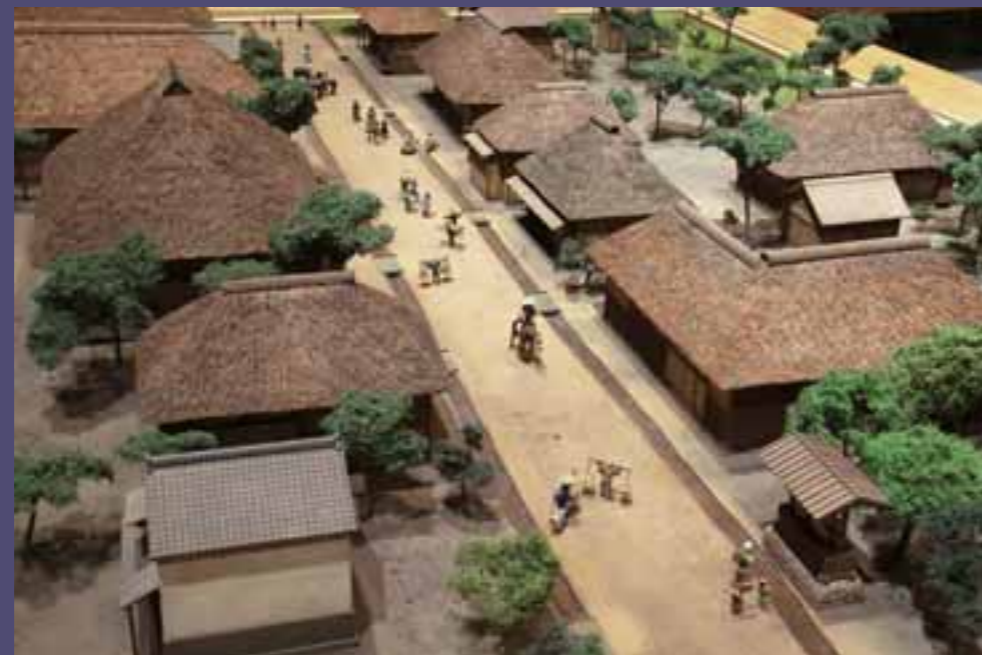
膝折宿の様子（ジオラマ模型）