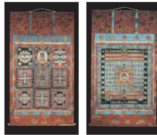
①市指定有形文化財 絹本着色両界曼荼羅

そして昭和四十二年三月十五日、市制施行により朝霞市が誕生。遠い記憶をたどる時、歴史の浪漫とともに新しい未来が見えてくることでしょう。