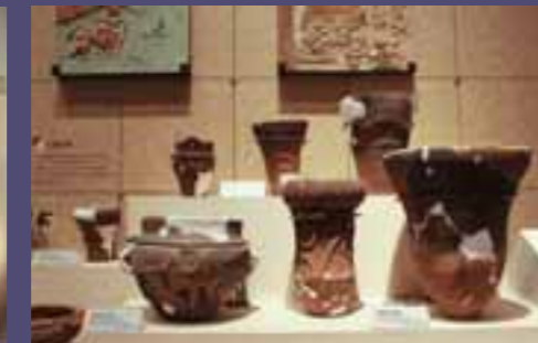
市内で出土した縄文土器