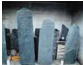
⑧県指定有形文化財 板石塔婆