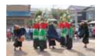
⑨市指定無形文化財 溝沼獅子舞