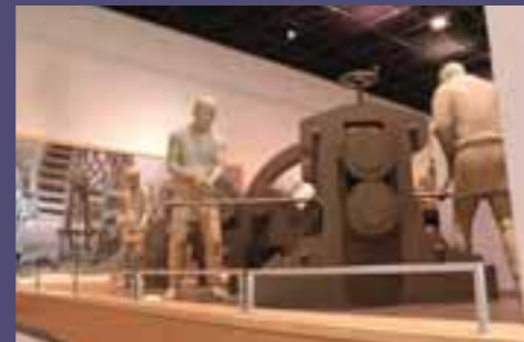
水車による伸銅一圧延(復元模型)