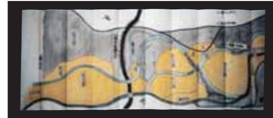
④市指定有形文化財 奥住家文書