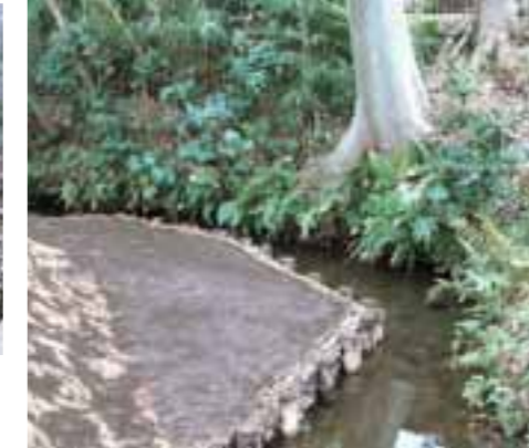
⑥市指定天然記念物 湧水代官水