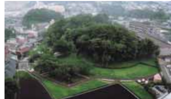
③県指定史跡 柵塚古墳