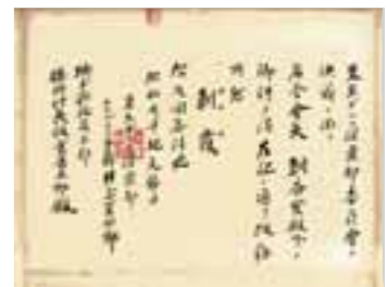
⑦市指定有形文化財 町名改称許可書