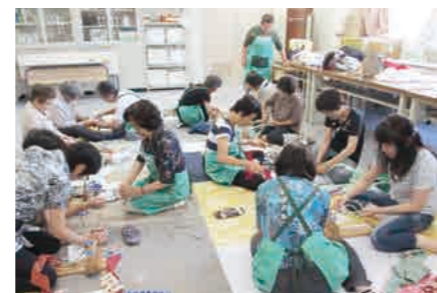
エコネットあさか講座「布ぞうり作り」