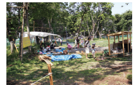
基地跡地暫定利用広場「朝霞の森」でのプレーパーク