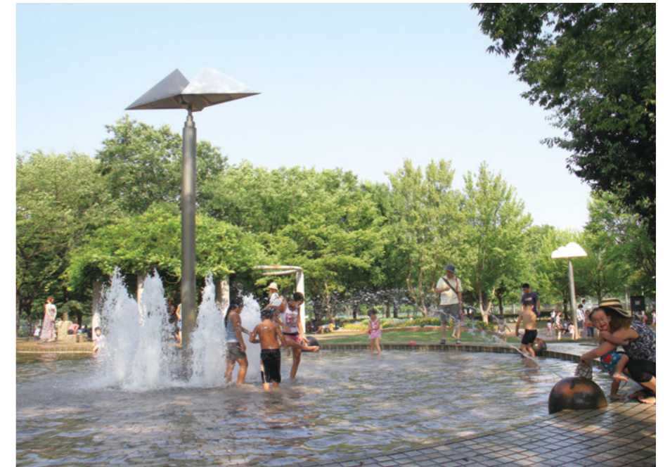
青葉台公園の噴水広場