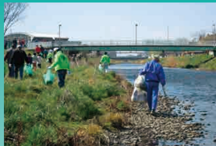
黒目川堤防清掃活動