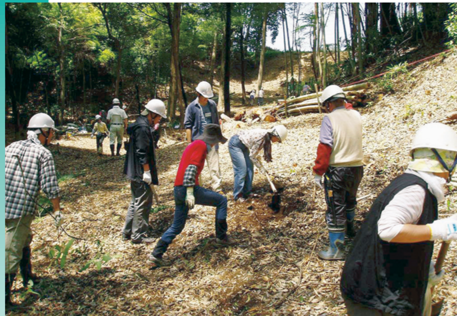
緑地ボランティア活動