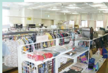
リサイクルショップ(エコネットあさか)