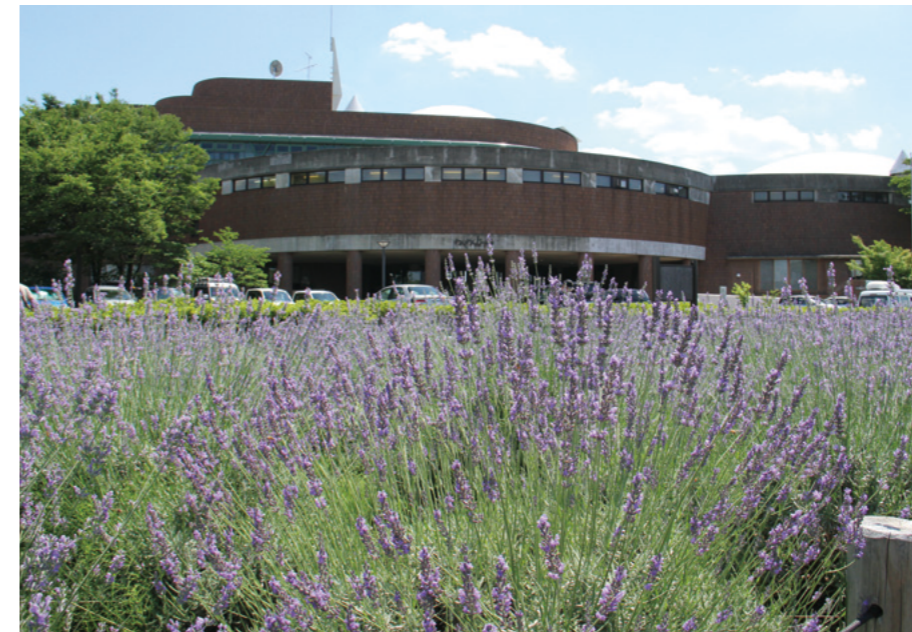
わくわくどーむ前のラベンダー畑