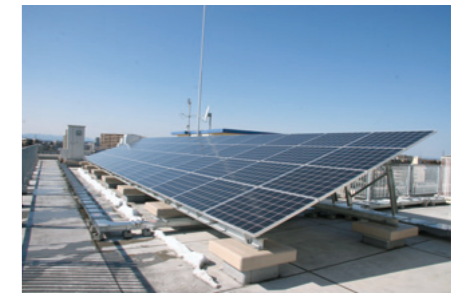
朝霞第五小学校のソーラーパネル