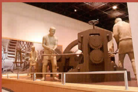
水車による伸銅一匠延 (復元模型)