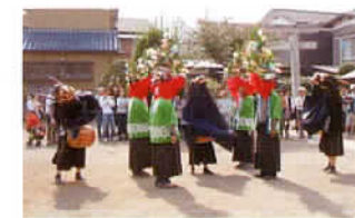
⑨市指定無形文化財 溝沼獅子舞

浪漫的薫りただよう、その名もゆかしい朝霞の里。 この地に人の痕跡が認められるのは、遥か昔、今から3万年以上も前のこと。人々は石器を手に、黒目川や新河岸川流域などの台地のまわりでたくましく暮らし、ここに朝霞の原風景が広がっていました。 そして、漁や狩猟を行い、土器を用いた縄文時代を経て稲作が主流となる弥生時代を迎えます。生産性の高まりとともに、古墳時代には豪族が出現しました。柁塚古墳は、そうした時代に造られました。平安時代の終わりころ、このあたり一帯は「広沢郷」と呼ばれ、鎌倉時代を通じて広沢氏が支配していました。室町時代以降は太田氏や北条氏が覇権を争っていました。 泰平の世を迎え、豊かな文化が開いた江戸時代。 この地は、幕府直轄の「天領」と旗本の「知行地」として統治され、ことに膝折宿は江戸と川越を結ぶ川越街道の4番目の宿場として栄えました。そのにぎわいは、どれほどだったでしょうか。また、このあたりは東日本における伸銅工業発祥の地としても知られています。 文明開化もなほの明治二十一年、近隣の村々が合併して「膝折村」と「内間木村」が生まれ、膝折村は昭和七年に朝霞町となり、同三十年には内間木村と合併しました。 そして昭和四十二年三月十五日、市制施行により朝霞市が誕生。遠い記憶をたどる時、歴史の浪漫とともに新しい未来が見えてくることでしょう。