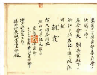
⑦市指定有形文化財 町名改称許可書