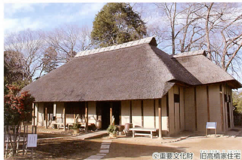
②重要文化財 旧高橋家住宅