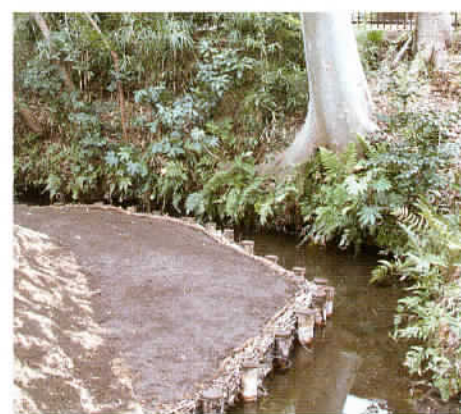
⑥市指定天然記念物 湧水代官水