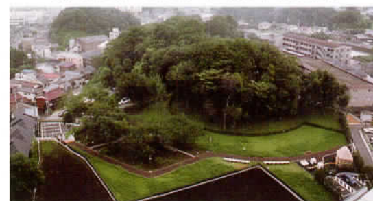
③県指定史跡 柁塚古墳