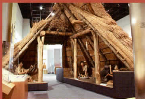
復元住居「古墳時代」(復元模型)