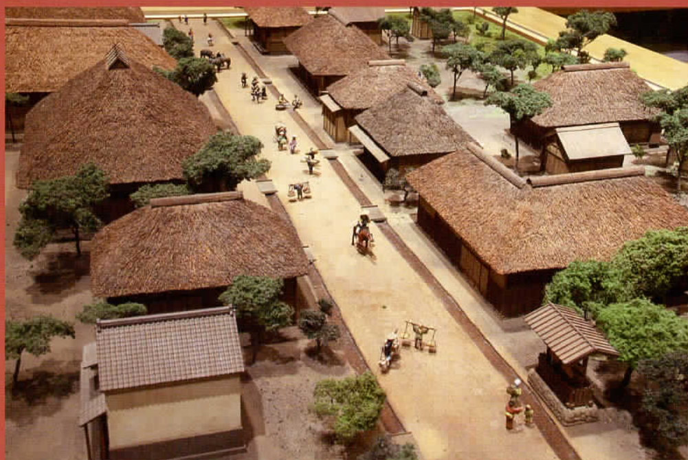
膝折宿の様子 (ジオラマ模型)