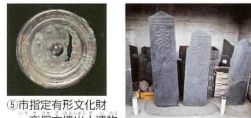
⑤市指定有形文化財 一夜塚古墳出土遺物 ⑧県指定有形文化財 板石塔婆