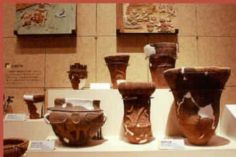
市内で出土した縄文土器